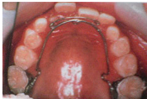
リンガルアーチ：混合歯列期に第一期の治療として、上の前歯4本を前に出します。前歯を外に出して、反対咬合を治します。